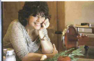
DA SINISTRA: TESSA GELISIO, NUOVO VOLTO DI COTTO E MANGIATO , VALERIA BENATTI DI KITCHEN IN LOVE , BENEDETTA PARODI, CHE CONDUCE I MENU DI BENEDETTA , E I QUATTRO PROTAGONISTI DEL PROGRAMMA CHEF PER UN GIORNO .